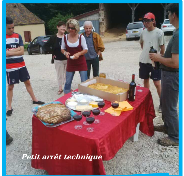
Petit arrêt technique