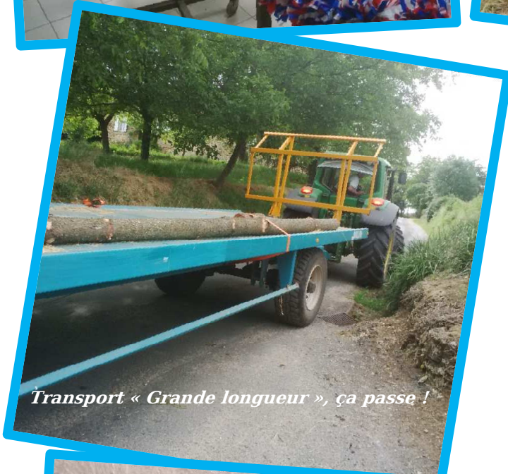
Transport « Grande longueur », ça passe !