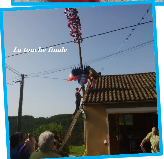
La touche finale