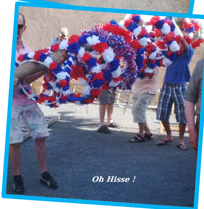
Oh Hisse !