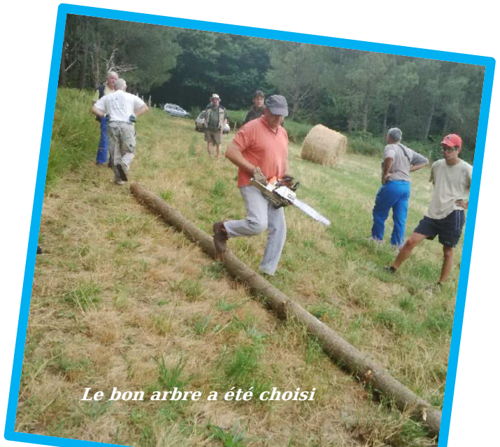
Le bon arbre a été choisi