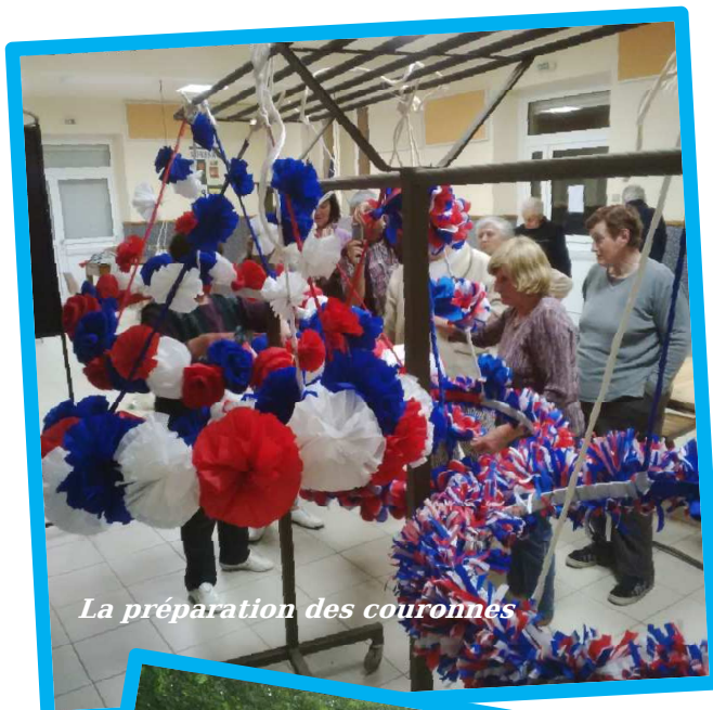
La préparation des couronnes