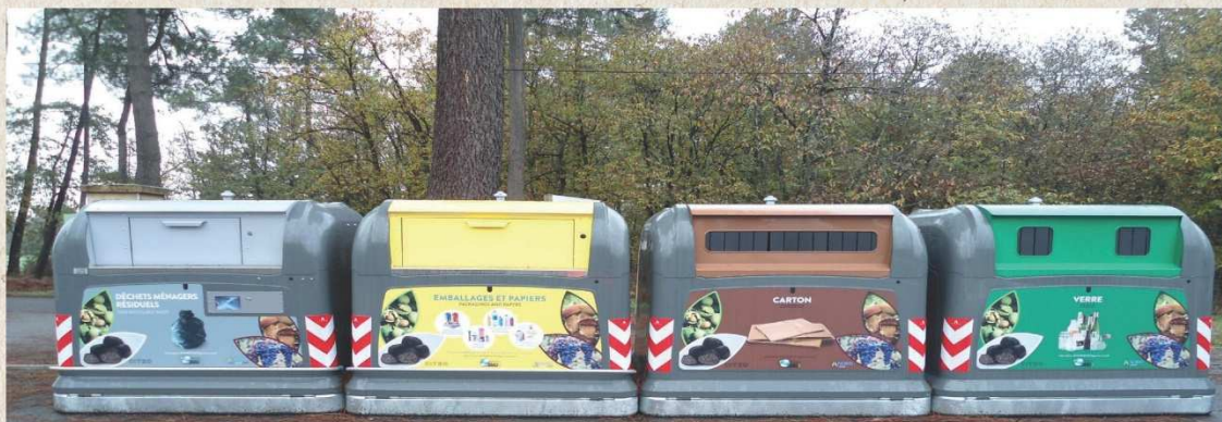
Exemple d'une station complète de bornes aériennes permettant le dépôt de 4 flux de déchets : les ordures ménagères, les recyclables (en vrac), le carton, et le verre.